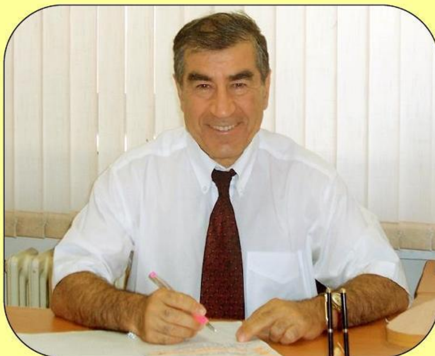
ПРЕЗИДЕНТ Арустамян Эрнест Санатрукович Академик