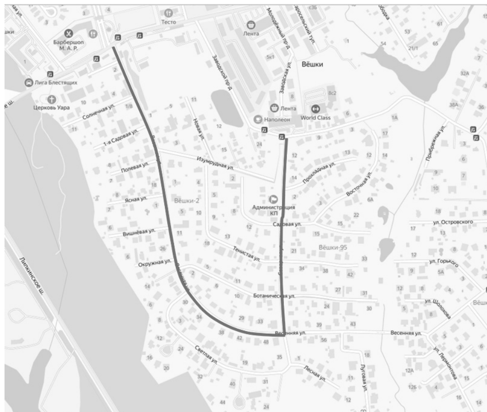
Схема объезда по автомобильным дорогам ул. Весенняя, ул. Северная в д. Вешки

Приложение к постановлению Администрации городского округа Мытищи от 22.08.2023 № 4282